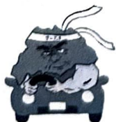
歩行者優先 イメージキャラクター 「さいたまお父さん」